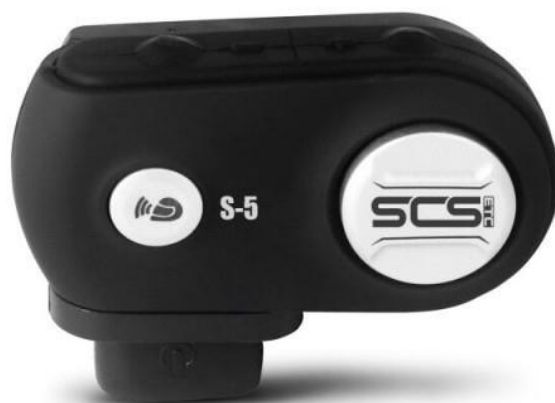
IMMAGINE DEL DISPOSITIVO

EVERT S.R.L. cap.soc.vers. 345.000,00 € REA - LU 209802 Via delle Cerbaie 78 55011 Altopascio (LU) P.IVA 02248480465