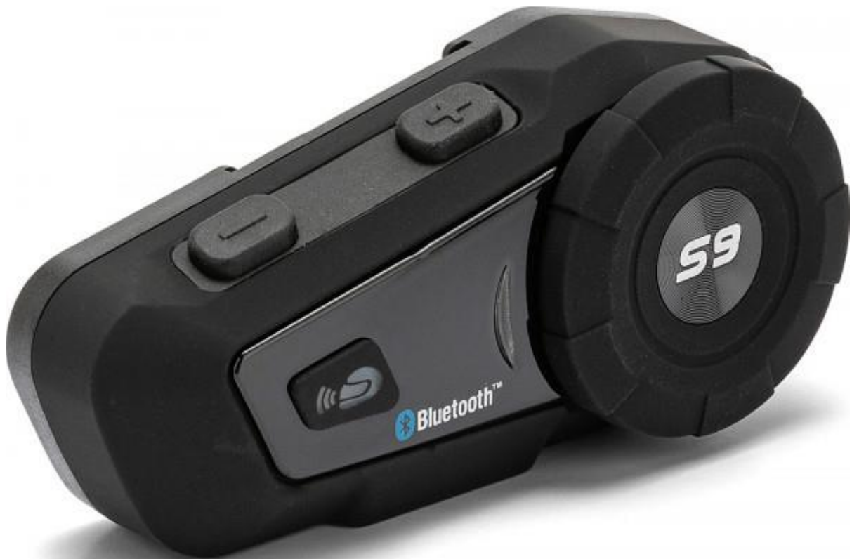
IMMAGINE DEL DISPOSITIVO